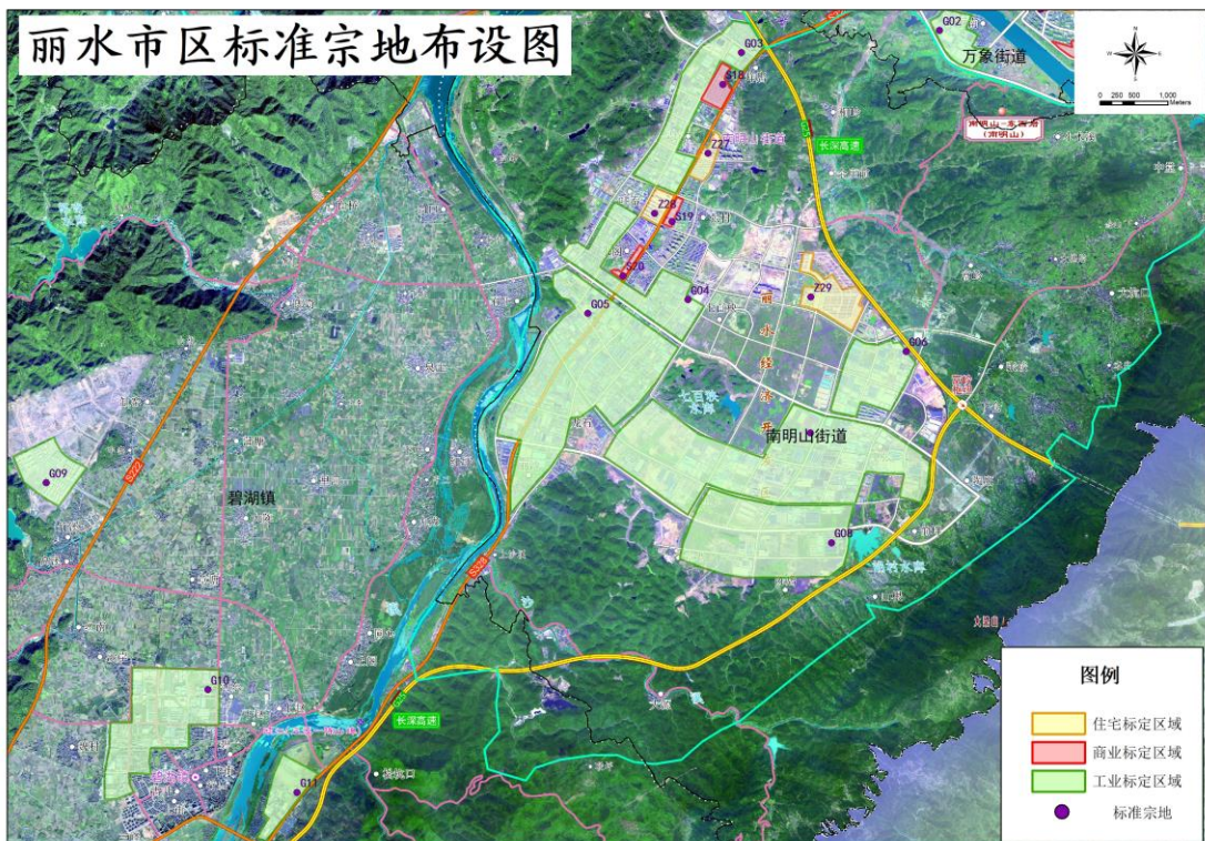
图4 丽水市区标准宗地布设图 2