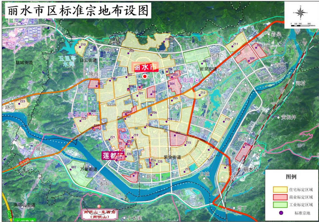
图3 丽水市区标准宗地布设图 1